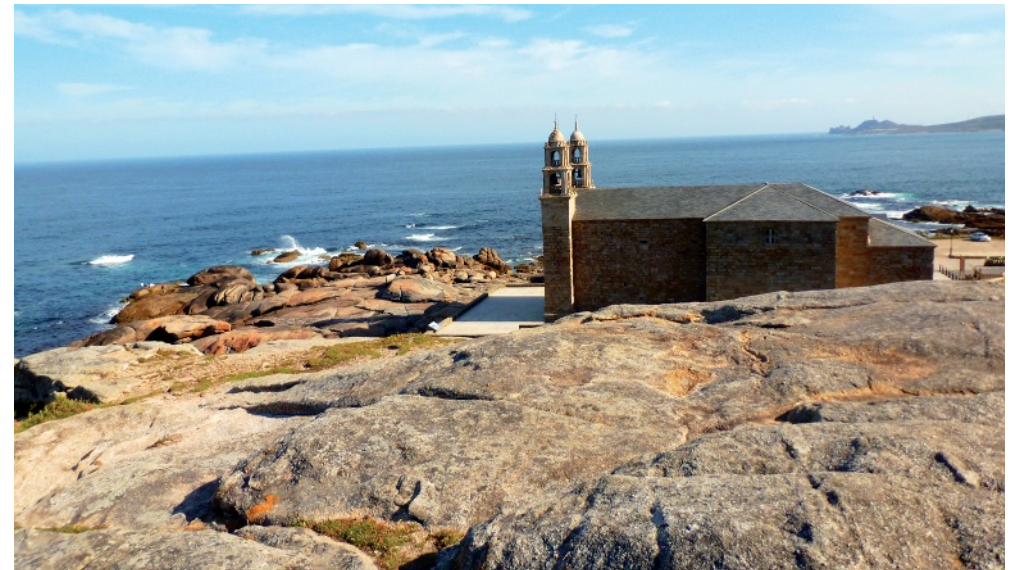
Kirche Virxe da Barca am Steinriff von Muxía

Ansonsten folgen Sie der Straße noch weiter in den Ort und sind nach 600 m nahe dem Hafen bei einer Holzbaracke angekommen, in der sich gelegentlich auch eine Stelle der 📄 Touristeninfo befindet (km 14,5). Wollen Sie auf dem schnellsten Weg weiter zur Kirche Virxe da Barca, so gehen Sie weiter geradeaus und befinden sich wie in der Karte genauer ersichtlich nach 500 m bei der 📄 Casa de Cultura. Immer der Hauptstraße folgend haben Sie nach weiteren 700 m Ihr Ziel am Riff und der Kirche erreicht (km 15,7).