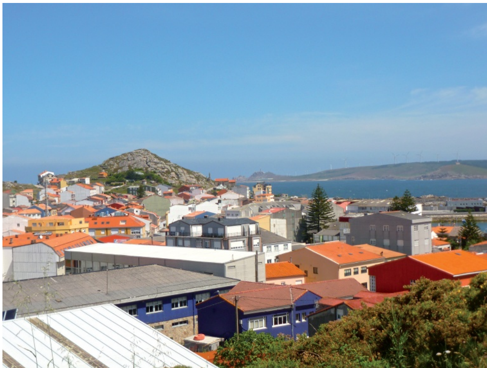
Blick über die Dächer von Muxía