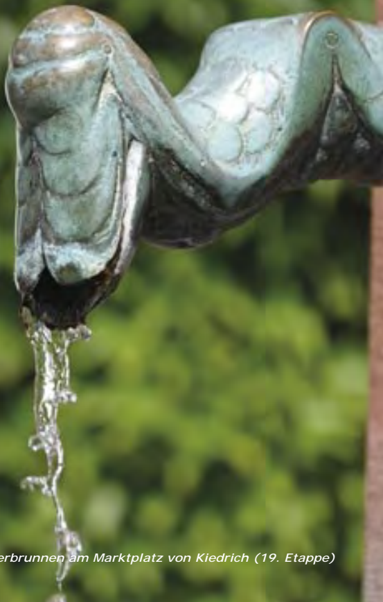
Trinkwasserbrunnen am Marktplatz von Kiedrich (19. Etappe)