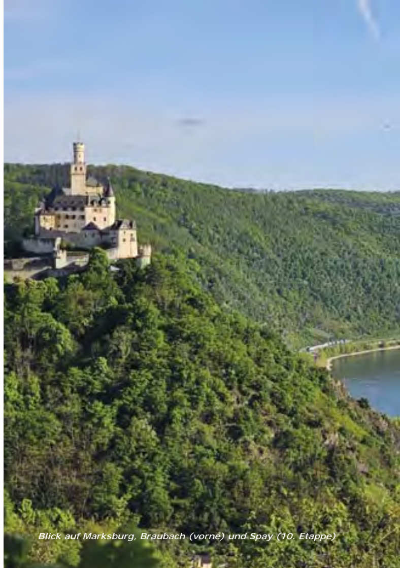
Blick auf Marksburg, Braubach (vorne) und Spay (10. Etappe)