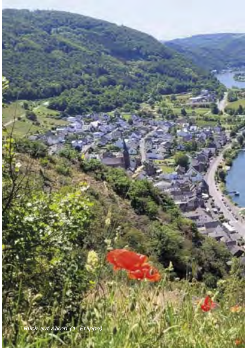
Blick auf Alken (1. Etappe)