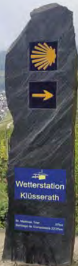
Pilgerstein an der Wetterstation Klüsserath (6. Etappe)