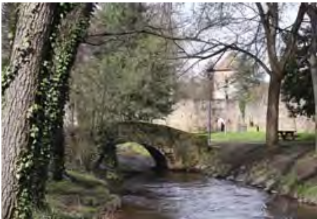
Der Start in Wissembourg

Los geht es direkt gegenüber vom Bahnhof Wissembourg. Hier finden Sie eine erste Übersichtstafel, auf der Sie sowohl Informationen über den gesamten Wegverlauf als auch über den ersten Abschnitt bis Obersteinbach erhalten. Bereits hier ist der Weg bestens markiert. Sie laufen zunächst nach links an der Straße entlang, die Sie kurz nach dem Restaurant de l'Europe an der Ampel überqueren. Sie folgen der Straße bis zu einem Kreisverkehr, überqueren diesen am Zebrastreifen und folgen dem GR 53 weiter geradeaus, jetzt direkt an dem kleinen Fluss Lauter entlang.