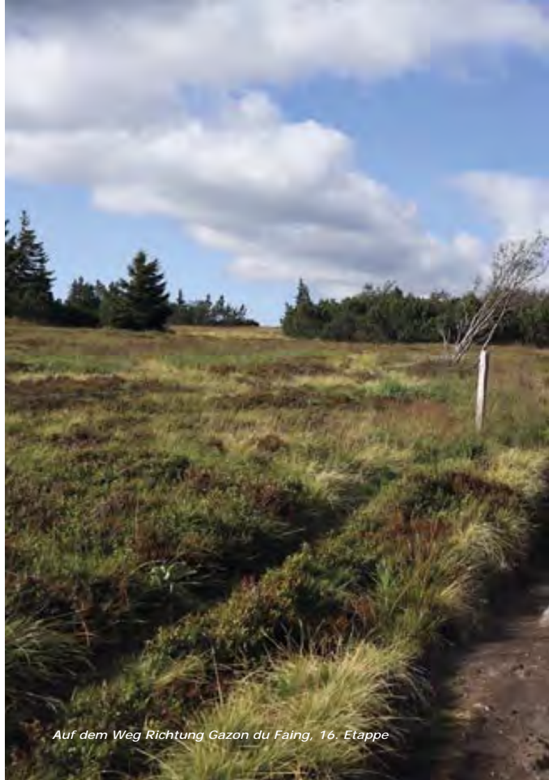
Auf dem Weg Richtung Gazon du Faing, 16. Etappe