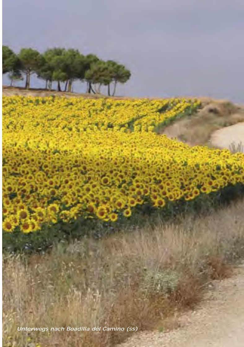
Unterwegs nach Boadilla del Camino (ss)