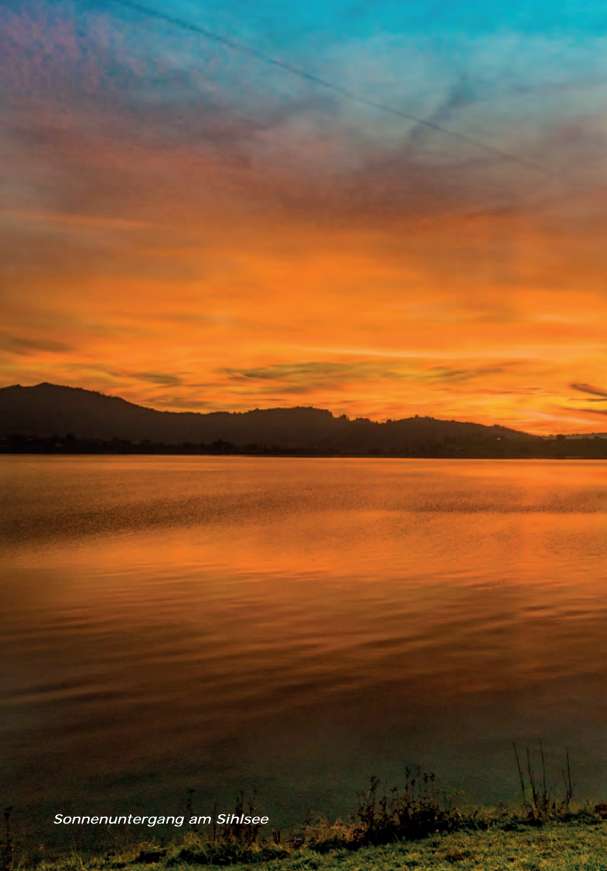
Sonnenuntergang am Sihlsee