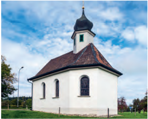
Die barocke Jakobskapelle in Kaltenbrunnen

Etwa 100 m hinter der Kapelle zweigen Sie rechts von der Hauptstraße auf eine einspurige Teerstraße ab. An einer Schule am Ende der Straße gehen Sie links. Voraus kommt nun Affeltrangen in Sicht. Am Ende der Straße gehen Sie weiter geradeaus auf einen unbefestigten Feldweg, der Sie an einem Gehöft vorbei wieder an die Hauptstraße am Ortseingang von Affeltrangen bringt.