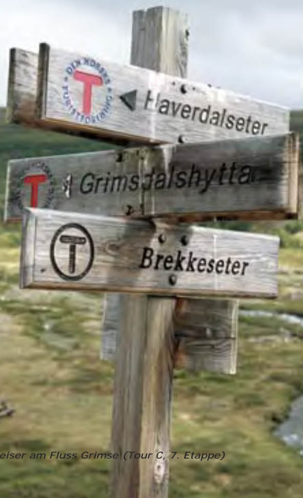
Wegweiser am Fluss Grimse (Tour C, 7. Etappe)