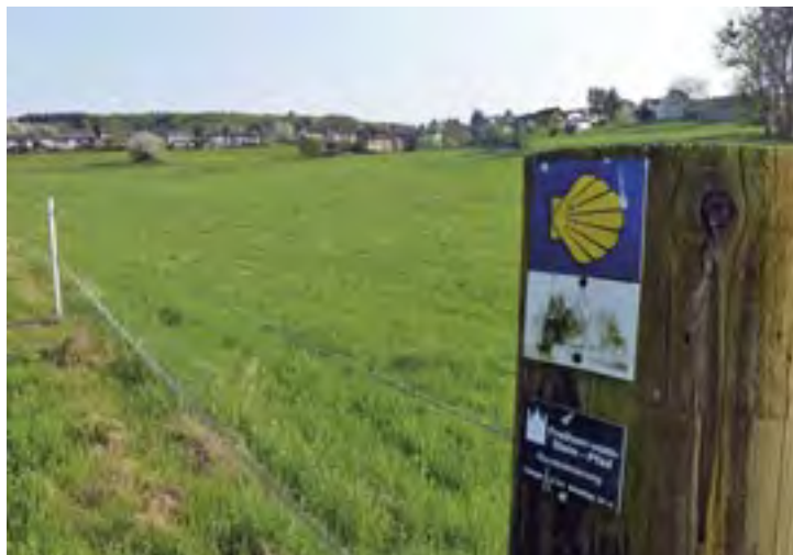
Camino vor Frücht mit altem Markierungszeichen (Etappe 6)