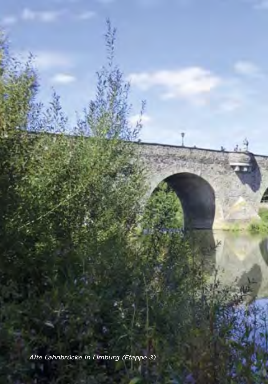
Alte Lahnbrücke in Limburg (Etappe 3)