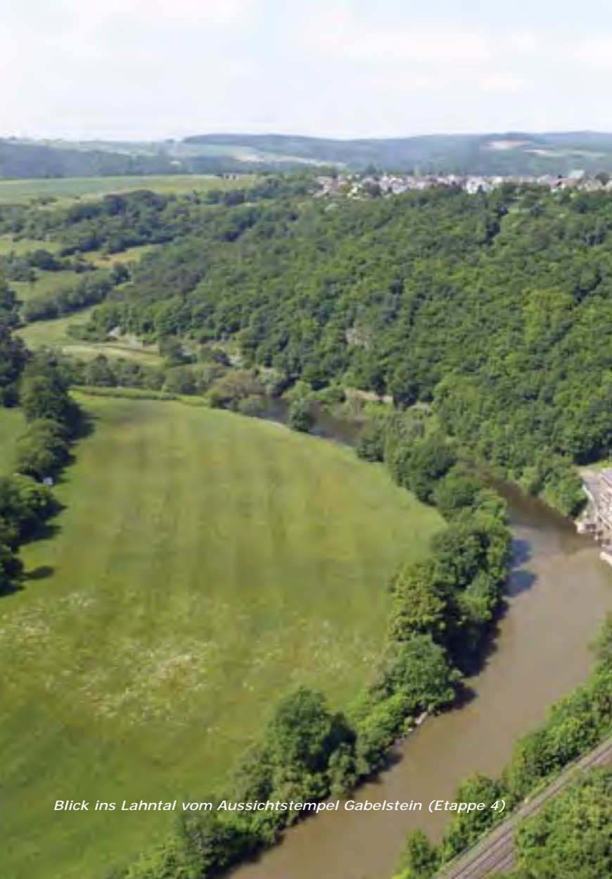
Blick ins Lahntal vom Aussichtstempel Gabelstein (Etappe 4)