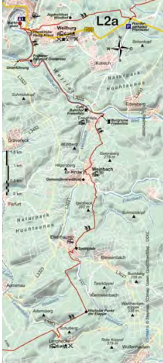
L2a ist