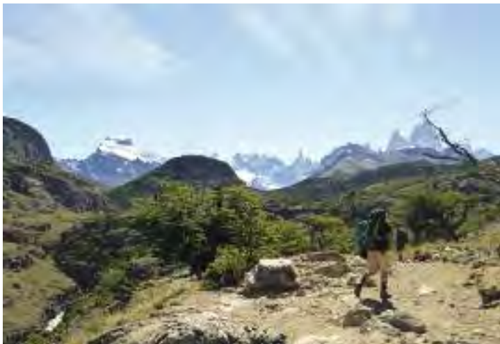
Blick vom Mirador Margarita

Weiter auf dem offiziellen Weg gelangen Sie ungefähr 1 km vor El Chaltén zum Mirador Margarita . Cerro Fitz Roy ist hier noch besser in Harmonie mit Cerro Torre zu sehen, allerdings ist das Laguna-Torre-Tal teilweise von einem Hügel verdeckt. Der Río Fitz Roy windet sich tosend durch die Schlucht zu Ihren Füßen. Den Namen hat der Aussichtspunkt vom kleinen Wasserfall Cascada Margarita auf der gegenüberliegenden Seite.