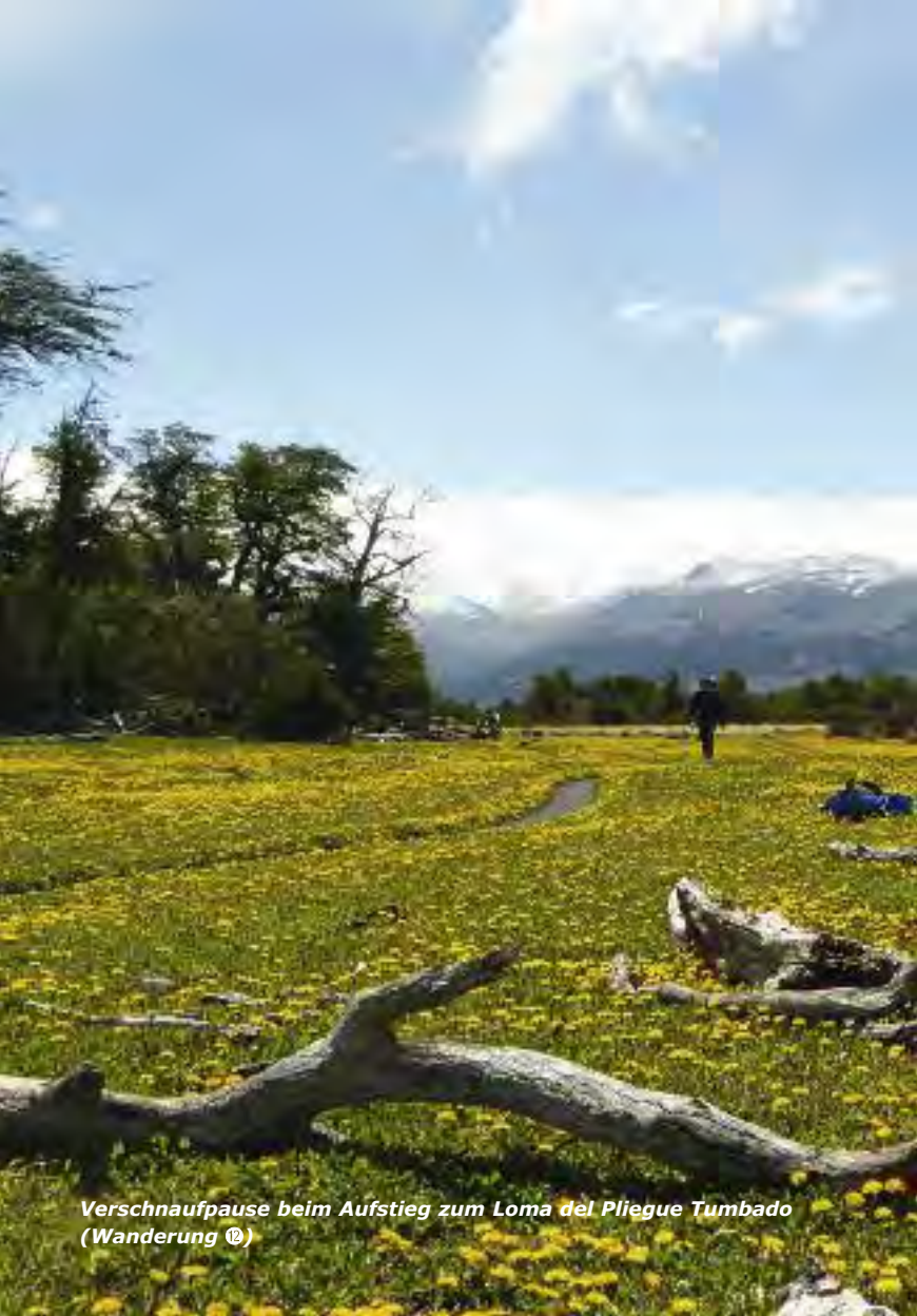
Verschlaufpause beim Aufstieg zum Loma del Pliegue Tumbado (Wanderung 12)