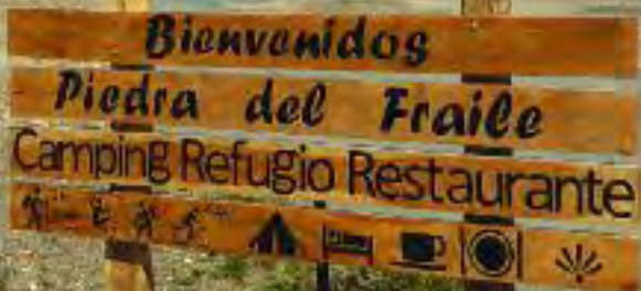
Begrüßungsschild an der Puente Río Eléctrico (Wanderung 1)